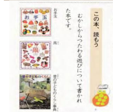
(小学「国語」の表紙と本文)

1頁全面を使って、「童心に戻り心も弾む」「お手玉を楽しむ」の企画で、「お手玉の段位」「病院で活用」「脳への効果」「つくる楽しみ」などの面から、詳しく「お手玉の魅力」が取り上げられました。