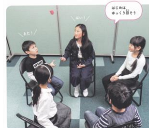
はじめるは、ひとつのお手玉を、じゅん番に回していき、なつてきたら、お友達に渡して、ふたつのお手玉を、お友達に回してあげます。

みんなで「わ」になり、ひとつのお手玉を、じゅん番にとりかえながら回していきます。