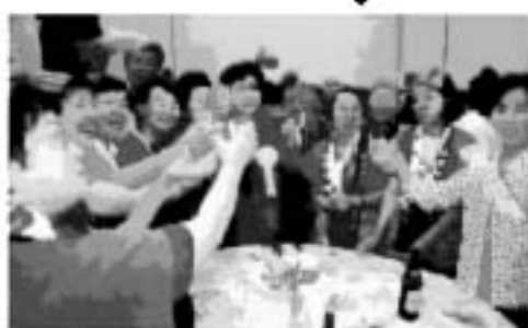
こんなに楽しく過ごせます。「明日の大会ガンバ!ソ〜!」