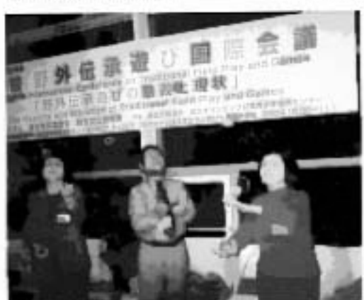
前日に開催された国際会議での一場面。

は、外国の子供たちも参加し、言葉を超えた交流ができました。毎年、段位認定審査は大々的にはしておらず、事前にご希望のあった方々のみ審査をさせていただいておりましたが、今年は申込み者以外にもたくさんの方が段位認定を受けられ現地と本部スタッフは大忙しでした。中には、6段を取得された方もいらっしゃいました。おめでとうございます。