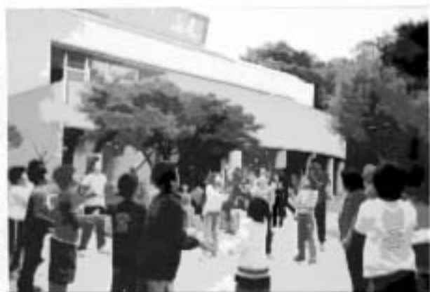
お手玉競技「よーい 始め！」