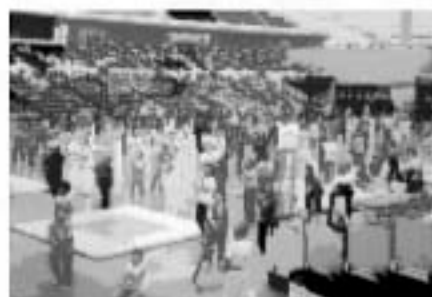
さあ！ 優勝目ざして！ 「気合いだアー」