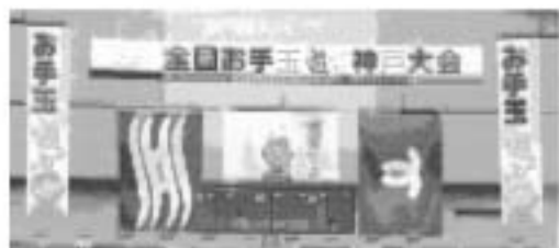
県旗、市旗、まん中大会旗