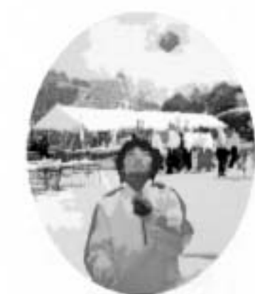
何度も挑戦してこんなにできるようになりました。

昨年、沖縄県で開催されたまなびピア。今年は愛媛県で10月9日（土）～13日（水）の5日間、松山市のアイテム愛媛・愛媛県民文化会館など、愛媛県内の各会場で開催されました。愛媛県内は相次ぐ台風の影響でJRN連休や道路は片側通行、更に開催初日には台風23号が四国の上空にあり、日本のお手玉の会では2日目からの参加となりました。