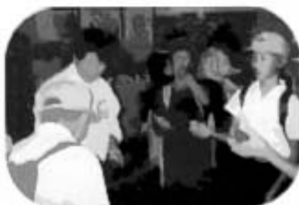
「ほくお手玉できるよ！」 「ほくもできるよ！」