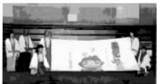
大会旗が岐阜県美濃加茂市へバトンタッチされました!