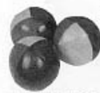
オーストラリア ビニール製のボールで 中にはバードシードが 入っている

は、外国の子供たちも参加し、言葉を超えた交流ができました。毎年、段位認定審査は大々的にはしておらず、事前にご希望のあった方々のみ審査をさせていただいておりましたが、今年は申込み者以外にもたくさんの方が段位認定を受けられ現地と本部スタッフは大忙しでした。中には、6段を取得された方もいらっしゃいました。おめでとうございます。