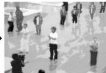
こんなに少なくなりました！ 優勝は誰の手に？ 緊張の一瞬！