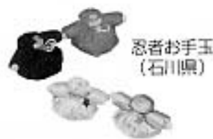
忍者お手玉 (石川県)

内容（予定） ・歴史と効能 ・作り方 ・ウォーミングアップ ・投げ玉の基本と技 ・寄せ玉、演舞 ・福祉現場のお手玉遊び ・幼児とお手玉、異世代で遊ぶ ・競技と審判 ・段位の取得