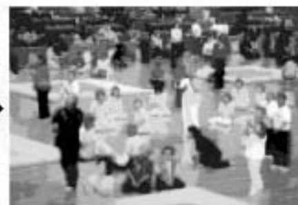
途中で落とした人は、その場に座って…！