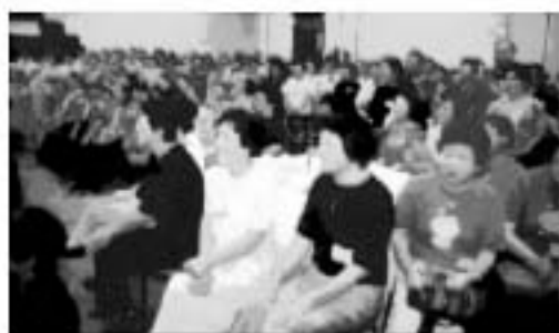
前夜祭に参加すると...? こんなにたくさんの人と...?

来年は岐阜県美濃加茂市での開催です。みなさん、ぜひご参加ください、お待ちしております。